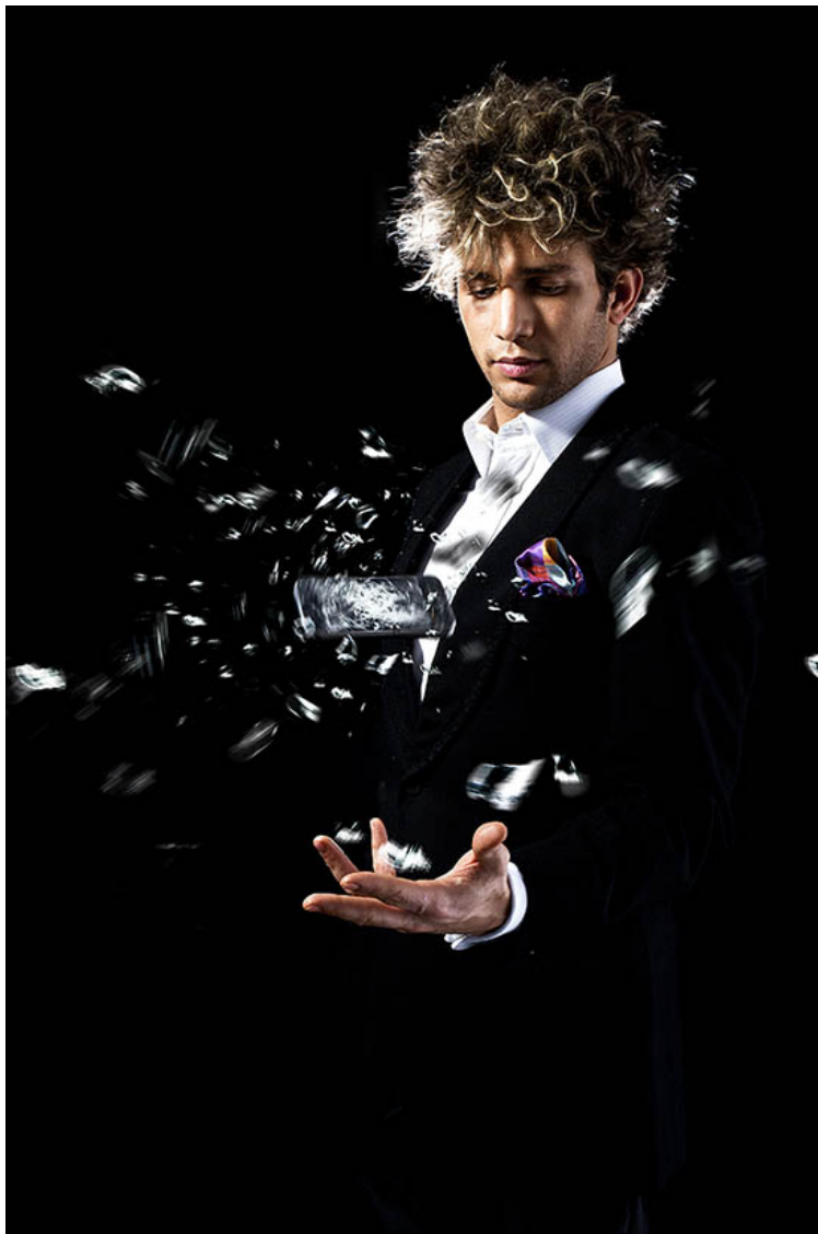
TECHNO MAGIC SHOW: RIDER TECNICO – REQUISITI MINIMI